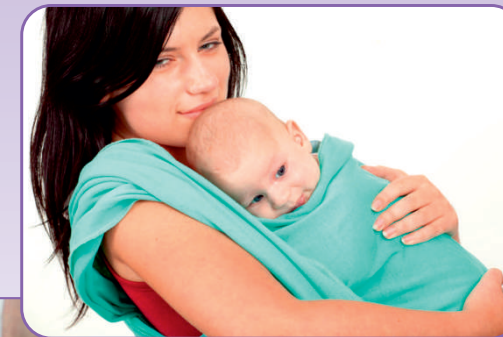
Konsultacje z doradcą laktacyjnym, chustonoszenie