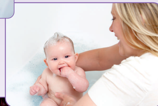
Instruktaż trenerek szkoły rodzenia w zakresie prawidłowej opieki nad noworodkiem