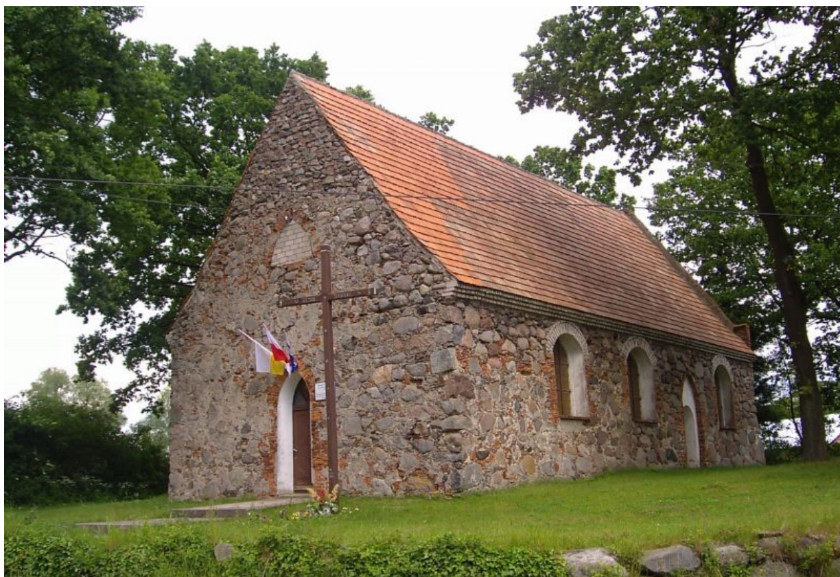
Kościół w Redle

Kościół filialny p.w. Matki Boskiej Nieustającej Pomocy. Budowla późnogotycka z ok. 1490 r. Murowany z nieobrobionego kamienia, z ceglanym szczytem wschodnim. Kościół salowy, rozplanowany na rzucie prostokąta. Odbudowany po zniszczeniach wojennych w 1978 r. W 1996 r. od strony półn. dobudowano zakrystię. Kościół orientowany. Położony w zach. części wsi. Parcela przykościelna wieloboczna, wydzielona kamiennym murem. W części zachował się drzewostan komponowany. Nagrobki usunięto. Zespół zakwalifikowany do wpisania do rejestru zabytków.